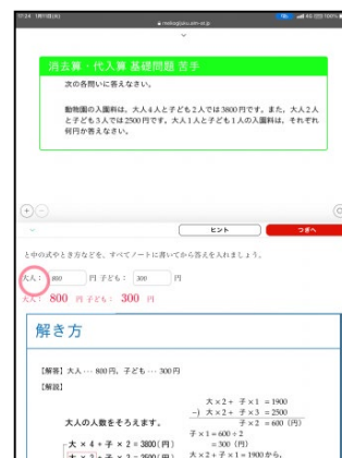
③ 苦手問題の類題を反復演習