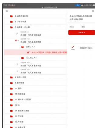
② 正答状況により苦手を特定