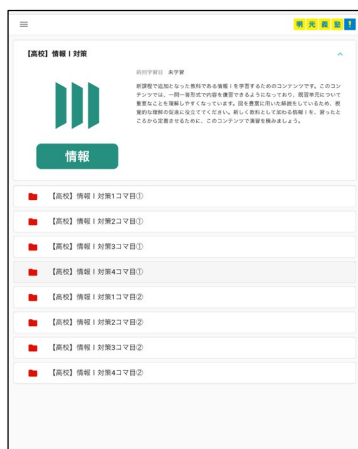
【「情報Ⅰ」対策コース】一覧

当授業は、情報科目に関連した用語の確認や仕組みを導入で丁寧に解説。その後、演習を解くと各自の苦手分野に応じた類題が自動で出題され、学んだ知識をもとに自分の力で問題を思考する力が身につきます。