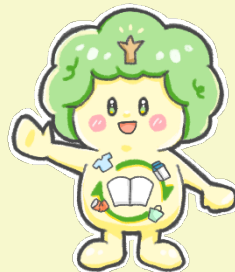
キャラクターコンテスト 最優秀賞作品 ソダチーノ