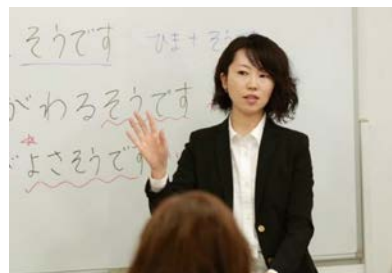
ベテラン講師の充実した授業